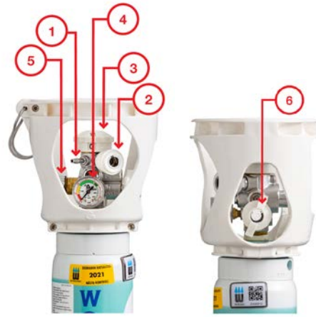
Bild 2. Viproxy ventil