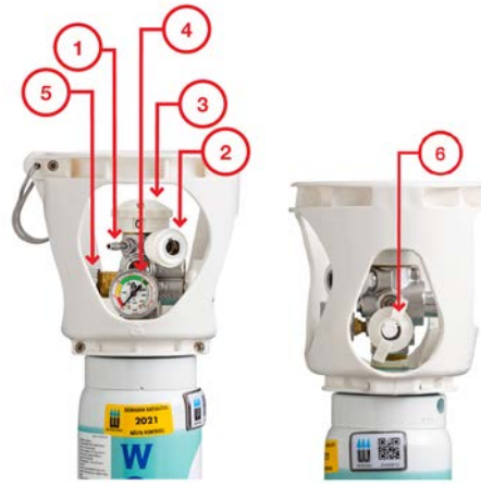
Kuva 2. Viproxy-venttiili