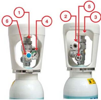
Bild 1. Cahouet V2D15 ventil