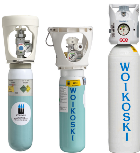
Cahouet Viproxy GCE Medivital

Woiikosken turvapulloventtiilit ovat turvallisia, helppoja käyttää, eikä niiden avaaminen vaadi erityistä voimaa. Venttiileissä on yhdistettynä venttiili, paineenalennin, painemittari ja virtaussäädin. Venttiilit sisältävät myös letkuliittimen ja pikaliittimen.