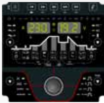
Comfort 3.0 AC