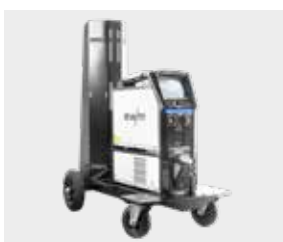
Verstaskärry Trolley XQ 55-3

Erinomaisen jäähdytystehon ja integroidun virtauksen ja lämmönvalvonnan ansiosta se on täydellinen lisä TETRIX XQ -hitsauskoneeseen.