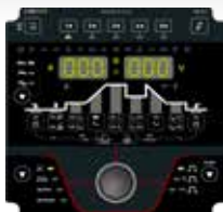
Comfort 3.0 DC

Tarttumisenesto Arcforce Selluloosapuikkoyhteensopiva Puikkohitsauspulssaus Kuuma-aloitus Vakio puikkohitsaus