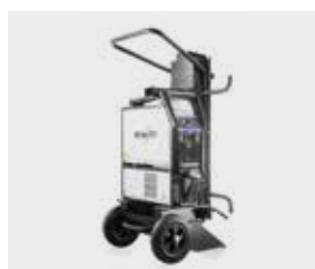
Rakennustyömaakärry Trolley XQ 35-3