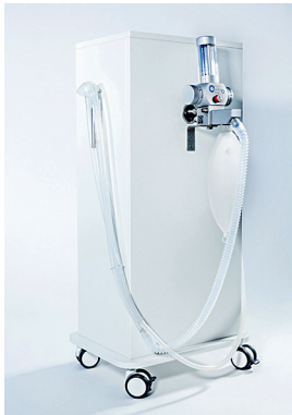
T205515 & T205518