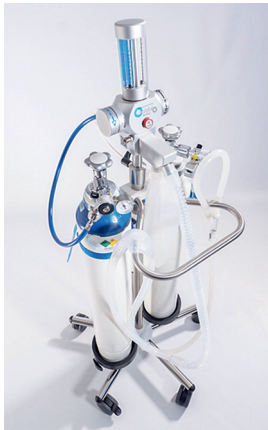
T205515 & T205520