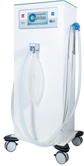
T205514 & T205518