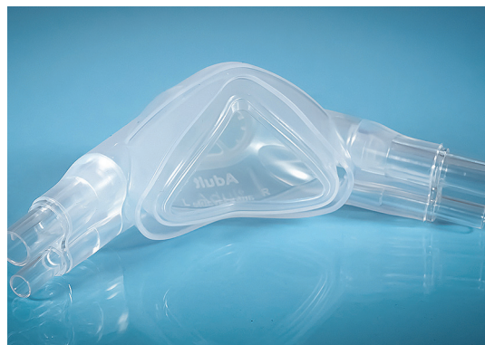
Sisempään maskiin annostellaan hoitokaasu ja uloimmasta maskista tapahtuu kaasun poisto.